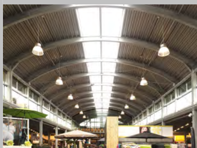
Binnenaanzicht met polycarbonaat luchtramen in de nok